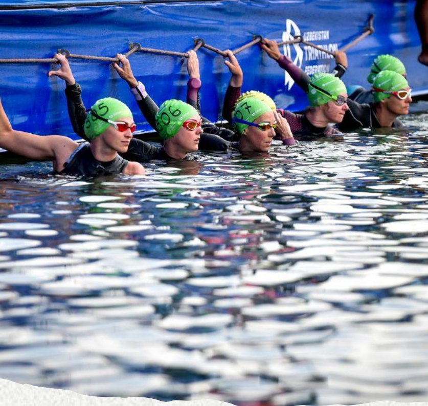
NUOTO 750 mt