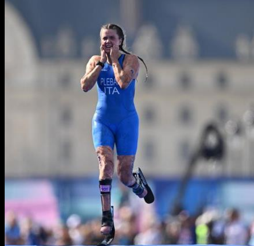
CORSA 5 km