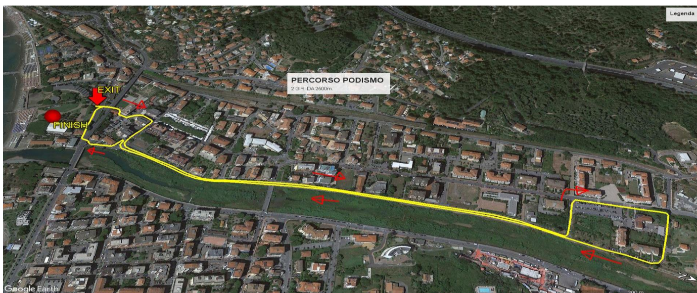
Corsa : 2 giri da km 2,5