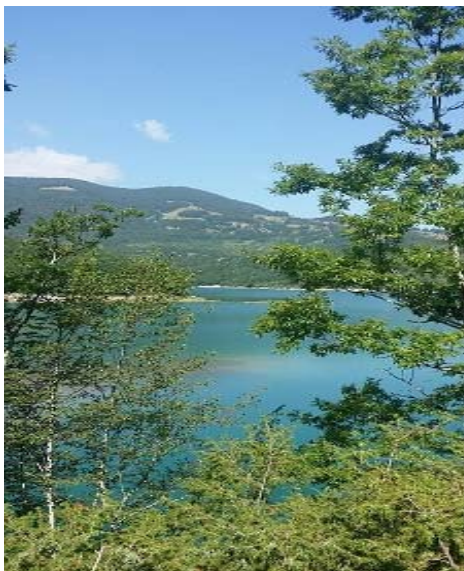
Lago della Montagna Spaccata